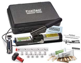
图示为 ATM20 配置

数显液压泵(内置充电电池)、充电器、USB 线、粘接剂、研磨垫、调胶板、搅拌棒、棉签、使用说明书、NIST 校准证书、演示光盘、坚固轻便的仪器箱