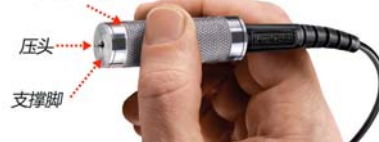
不锈钢滚花探头外壳